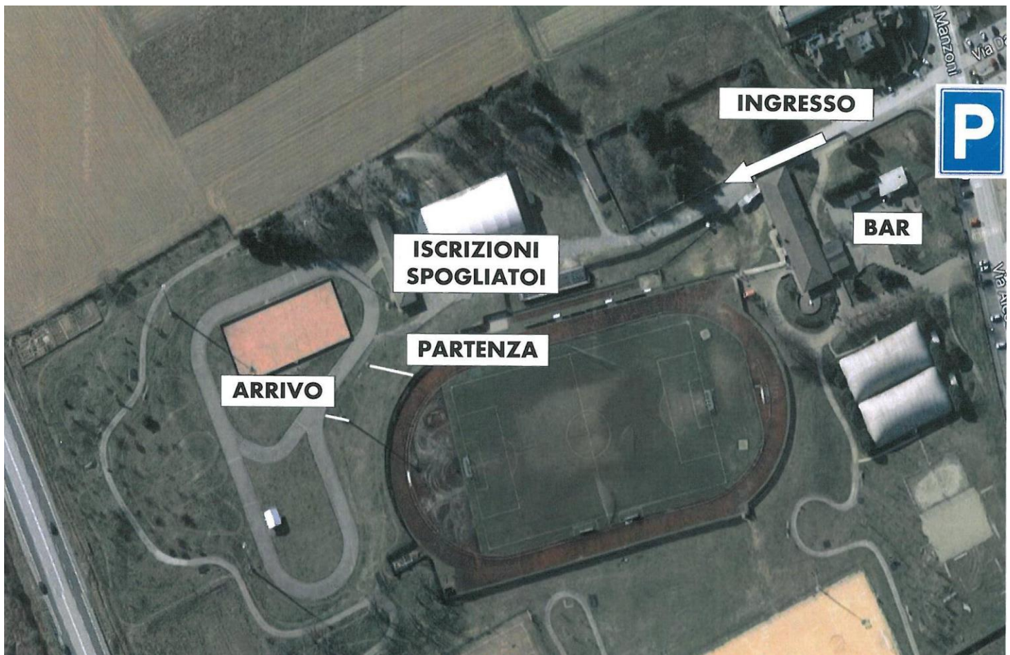
Giro Piccolo mt. 450 ca.